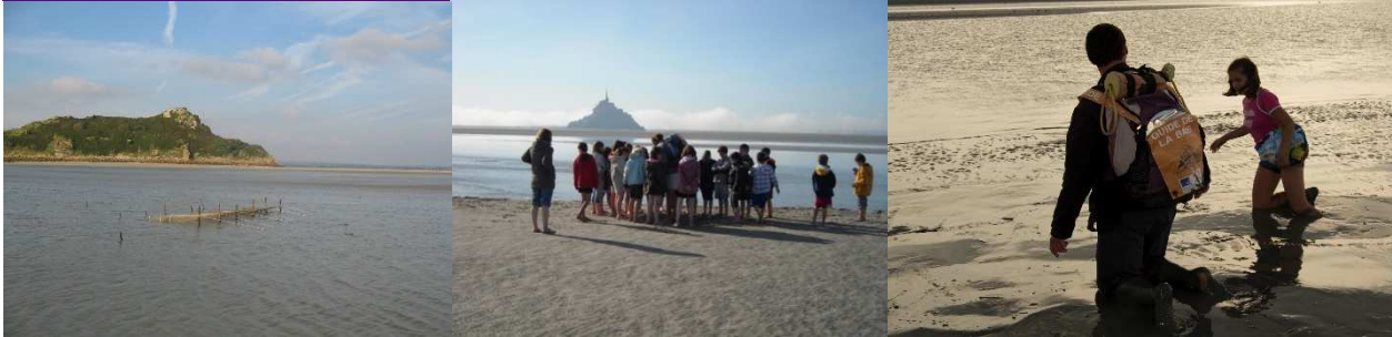
Bec d'Andaine (plage de Genêts), Saint-Léonard, Courtils, Mont Saint-Michel.

Cette marche pleine de sensations inoubliables à travers les sables, la tange et les cours d'eau de la baie permet aux enfants de découvrir en toute sécurité sous la conduite d'un guide professionnel les paysages et ambiances de la baie.